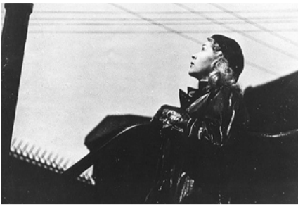
The True Story of Lili Marlene (1944, Humphrey Jennings)