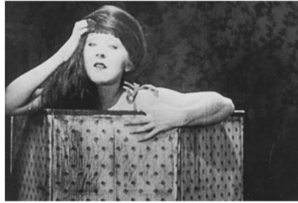
Nana (1926, Jean Renoir)

Wenn wir über Filme sprechen, meinen wir das zu thematisieren, was auf der Leinwand gezeigt wird. Doch nicht alles, was uns Filme sehen lassen, wurde tatsächlich abgeleitet und projiziert. Das Filmbild stellt stets einen Ausschnitt der Welt dar, zugleich verweist es mit unterschiedlichen Strategien auf ein Außerhalb des Bildes. Dieses spielt für Erzählung und Ästhetik eine große Rolle und öffnet mehr oder weniger stark Assoziationsräume. Filmbilder sind also zugleich begrenzt und endlos. Gemeinsam möchten wir die Grenzen des Filmbilds erforschen, bewusst verlassen und die Filmwelt außerhalb ihrer visuellen Grenzen erkunden. (V.G.) Präsentiert von Film museumsmitarbeiterin Victoria Grinzinger