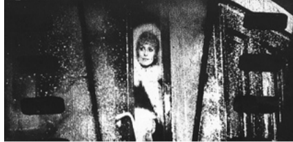
L'arrivée (1998, Peter Tscherkassky)

Das Kino war das erste Medium, das bewegte Bilder auf einer Leinwand zeigen konnte, möglich gemacht durch den kinematographischen »Motor«, der Einzelbilder kontinuierlich fortbewegt. Aber auch andere Motoren haben unsere Lebenswelt ver-