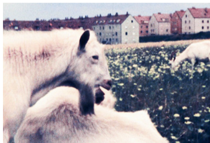
Am Rande der Großstadt (1956, Viktor Alexander)

Film ist nicht nur Erzählmedium und Kunstform, er ist auch Dokument von Alltagskultur und -geschichte. Amateur-Filmemacher*innen halten inzwischen seit über 100 Jahren besondere Momente ihres Lebens fest, und liefern damit oft unbeabsichtigt auch einzigartige Dokumente des Stadtlebens. Diese »rohen« Filmbilder sind aber nicht einfach zu lesen und lassen sich nie auf einfache Aussagen reduzieren. Oft verblüffend, bisweilen verwirrend, aber immer faszinierend liefern sie Bestätigungen wie auch Gegenbilder zu den dominanten Erzählungen in Zeitgeschichte und politischer Identitätsbildung. In der Veranstaltung zeigen und diskutieren wir Beispiele solcher Filme und versuchen so ein vielschichtiges Bild Wiener Alltagskultur zu zeichnen. (S.H. & M.L.)